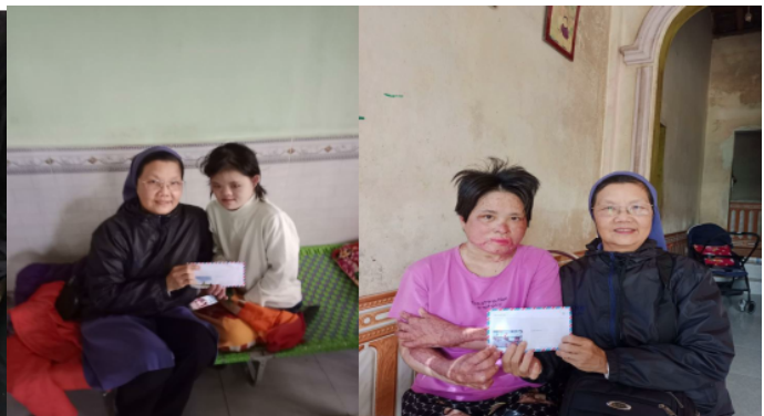
ĐẠI LỘC - QUẢNG TRỊ

Niềm hạnh phúc không thể giấu được trên khuôn mặt các anh chị em khi nhận sự quan tâm của Quý Ân nhân. Mong sao niềm vui luôn được tiếp nối qua sự chung sức chung lòng của Quý Ân nhân.