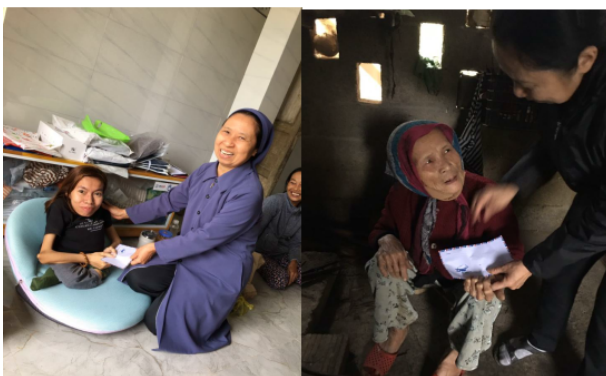
TÂN LƯƠNG - QUẢNG TRỊ

Nên tuy có chút khó khăn vì đường xá xa xôi và đôi khi hiểm trở, nhưng các Soeurs cảm thấy rất ấm lòng khi nhìn thấy niềm vui và sự hạnh phúc thể hiện trên khuôn mặt của những người nghèo qua những lần thăm viếng, động viên, sẻ chia và trao tặng những phần quà.